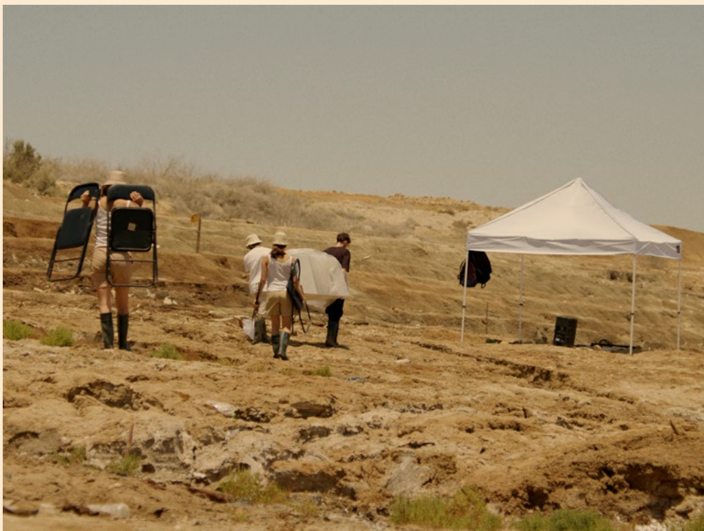
שלושה חודשים, 2024-2023, וידאו, 14:22 דק' Three Months , 2023-2024, video, 14:22 min ثلاثة أشهر, 2024-2023, فيديو, 14:22 دقيقة