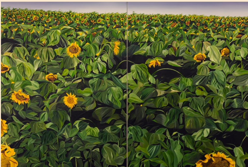
חמניות (דיפטיר), 2023, שמן על בד, 200x300 ס"מ Sunflowers (diptych) , 2023, oil on canvas, 200x300 cm دوار الشمس (لوح خشبي مزدوج), 2023, زيت على قماش, 200x300 سم