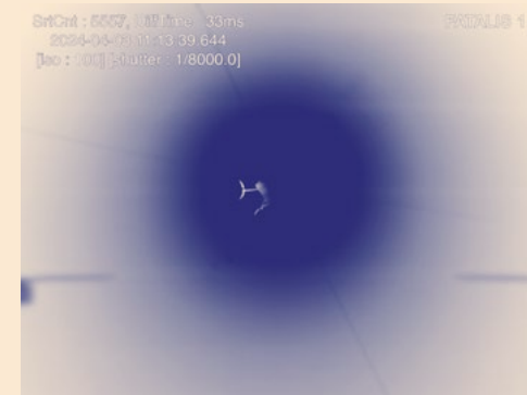
פטאליס 2.0, 2024, וידאו, 10:00 דק'

מדויקים באוניברסיטה תל אביב במטרה לבחון מחדש את סופו של הסיפור המיתולוגי. בעבודתה, הרחפן שרצה לעוף קרוב מדי לשמש נתקל בכוח חזק לא פחות ממנה: רשויות התעופה בישראל.