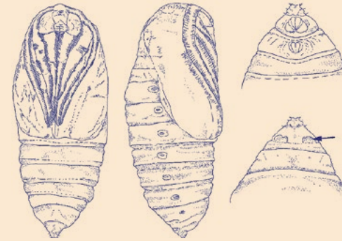
שרטוטי השראה לעבודה

מוסיפה פרשנות משלה בשילוב קרמיקה וסיליקון, ומדמיינת יצור מעתיד לא־רחוק כתוצר לקוי של טכנולוגיה עתידנית, או כעדות לפלישה חוצנית. את המיצב מלווים אובייקטים נוספים שנשתלו בין עבודות התערוכה, כמו פּוֹשֵׁט (2024), עבודת לטקס ושעווה שמוצבת במעלה המדרגות, ומקבץ מתוך סדרת הפסלים Foreigners (2023) שנוצרו מקרמיקה ושעווה בממדים משתנים.