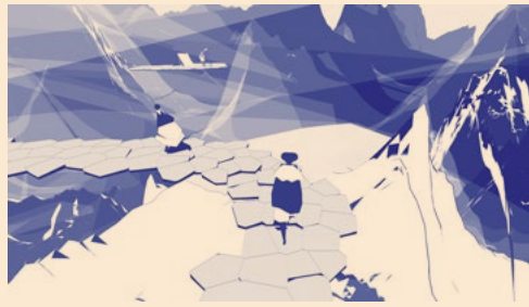
PAUSE , 2021, interactive video

to stop and linger; the game ends wherever he or she decides to stop.