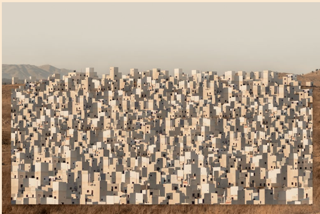
עיר בלתי נראית, 2023, צילום, קולאז', הזרקת דיו פיגמנטי על נייר ארכיבו, 120x180 ס"מ Invisible City , 2023, photography, collage, archival pigment print, 120x180 cm مدينة غير مرئية, 2023, صورة فوتوغرافية, كولاج, طباعة نافثة للحبر على ورق أرشيفي, 120x180 سم