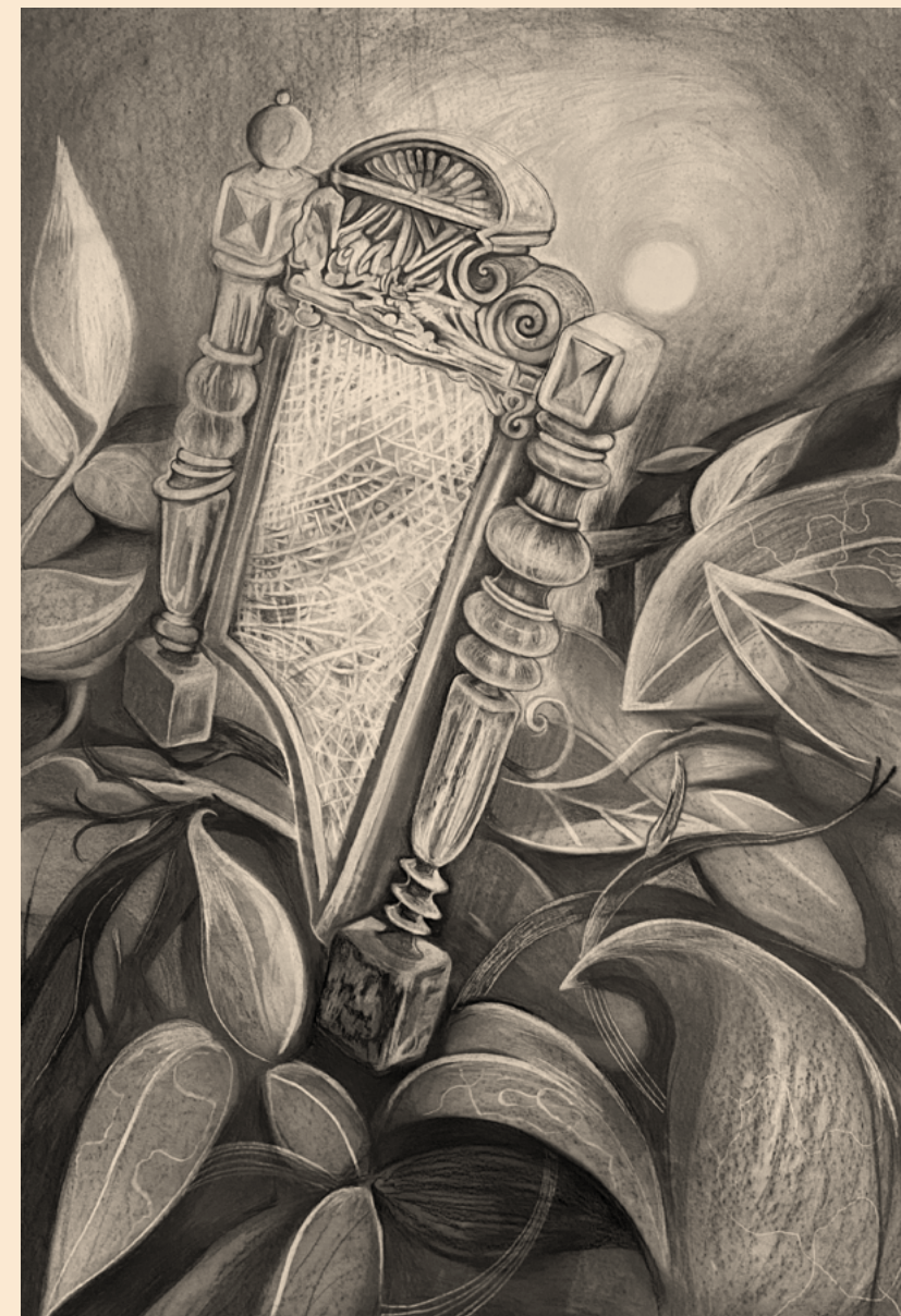
ישם , 2023, רישום פחם וגרפית על נייר, 160x110 ס"מ There , 2023, coal and graphite on paper, 160x110 cm هناك , رسم بالفحم والجرافيت على ورق, 160x110 سم