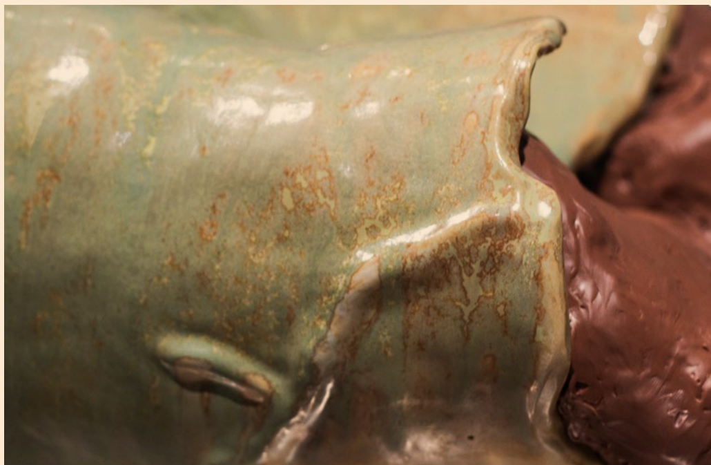
Golem , 2024, מיצב ופיסול, קרמיקה וסיליקון, 30x95x45 ס"מ Golem , 2024, installation and sculpture, ceramics and silicone, 30x95x45 cm Golem , 2024, عمل إنشائي ونحت, خزف وسيليكون, 30x95x45 سم