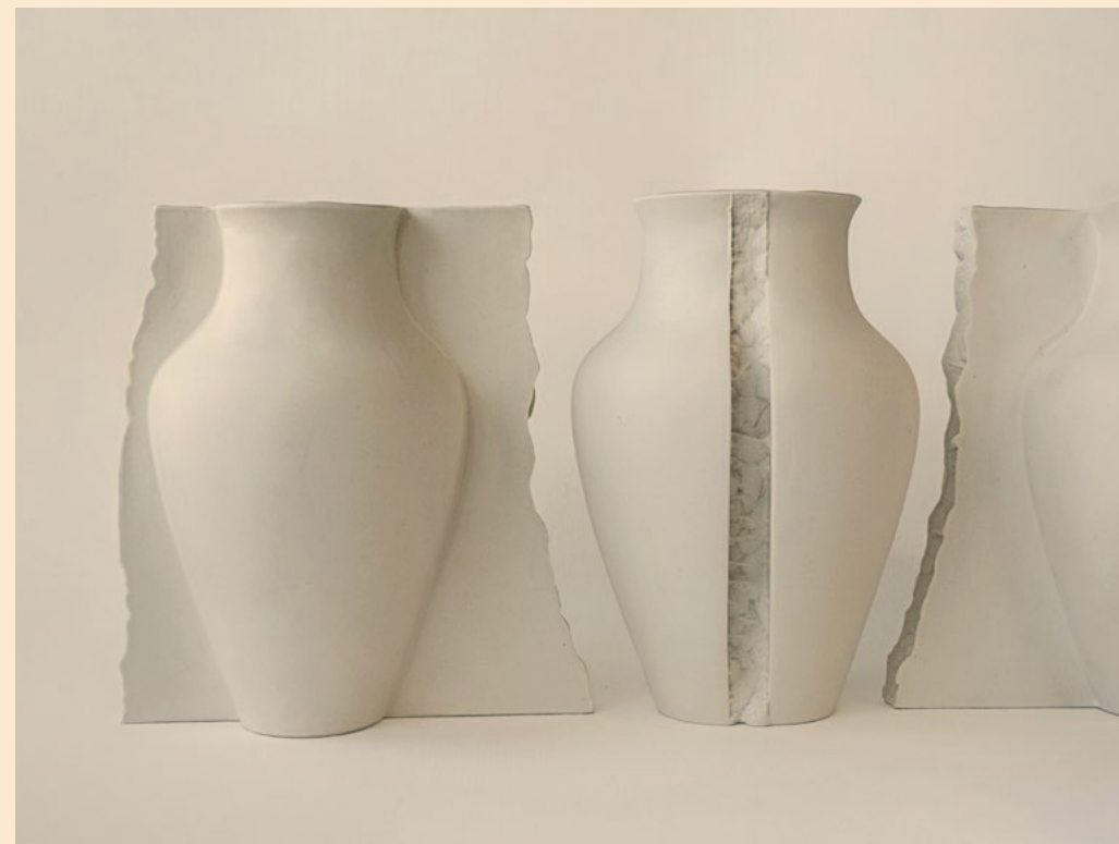
שבר כלי, 2024, מיצב פיסולי, פורצלן, מתכת ולוחות גבס, ממדים משתנים Broken Vessel , 2024, sculptural installation, porcelain, metal and plaster boards, variable dimensions مُحطّم, 2024, عمل إنشائي, خزف, معدن وألواح جبس, أحجام مختلفة