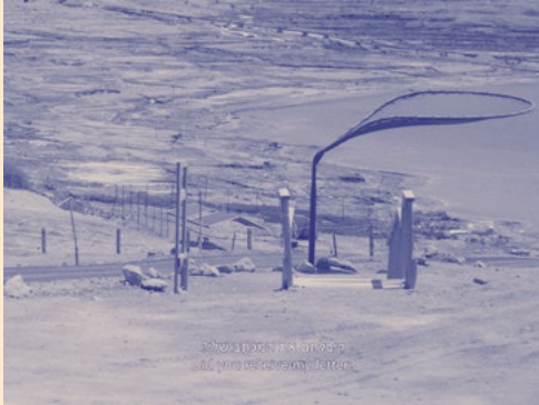
שלושה חודשים, 2023-2024, וידאו, 14:22 דק'