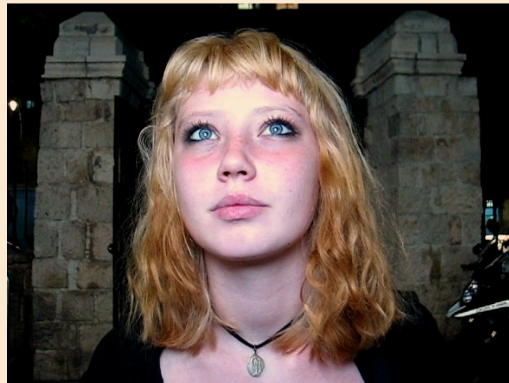
כלל, 2022-2024, וידאו, 40 דק' (לופ) Clal , 2022-2024, video, 40:00 min, loop כלל, 2024-2022, فيديو, 40 دقيقة (عرض متكرر)