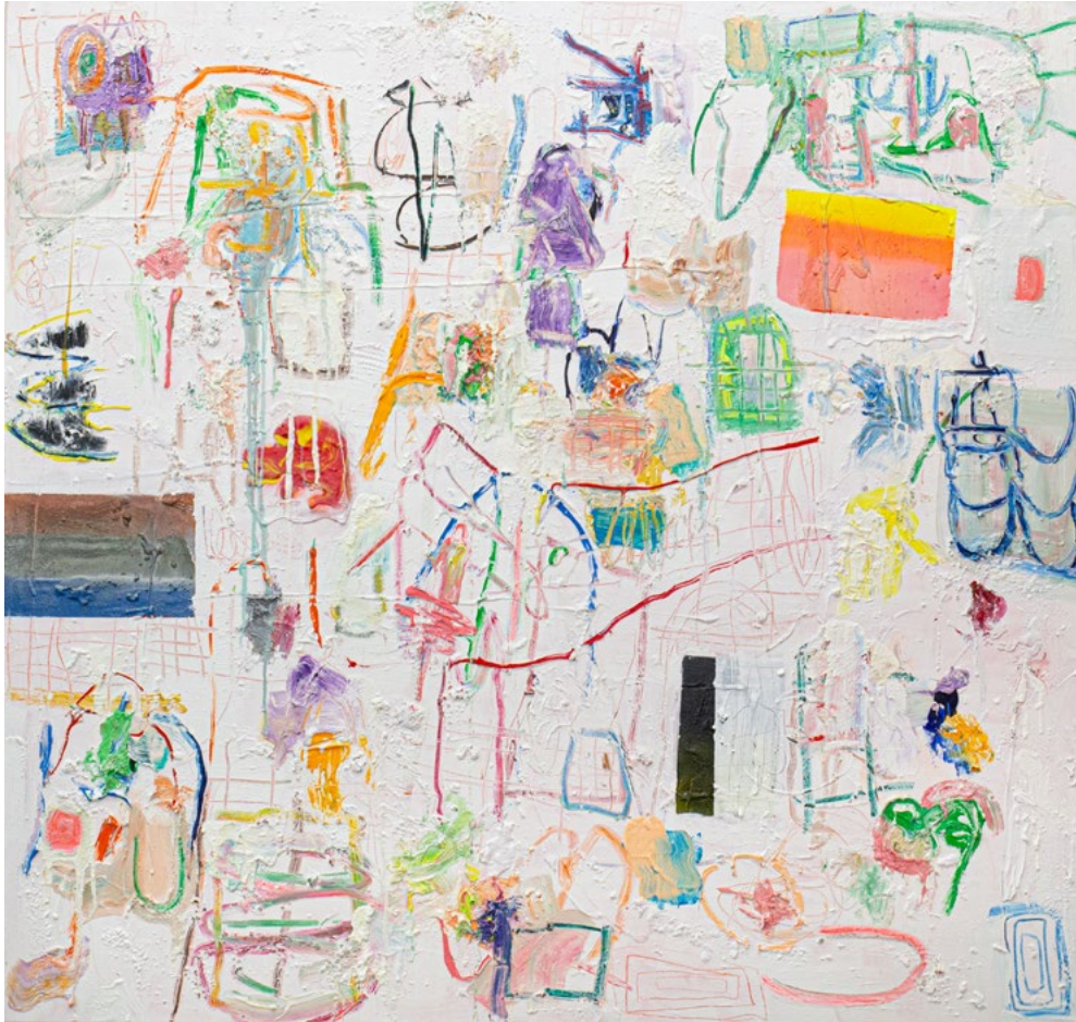
ישי חוג'סטה * Yishay Hogesta * ישאי חוגסטה

6666, טכניקה מעורבת על בד, 150x140 ס"מ, 2024 6666, mixed media on canvas, 140x150 cm, 2024 6666, تقنية مختلطة على قماش, 150x140 سم, 2024