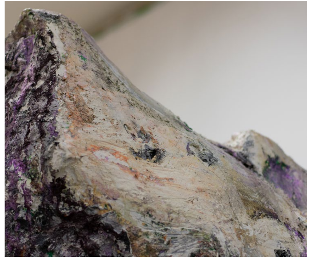
{ נועה מור }

נגמר, טכניקה מעורבת, מידות משתנות, 2025 End, mixed techniques, various dimensions, 2025 انتهى، وسائط مختلفة، مقاسات متغيرة، 2025