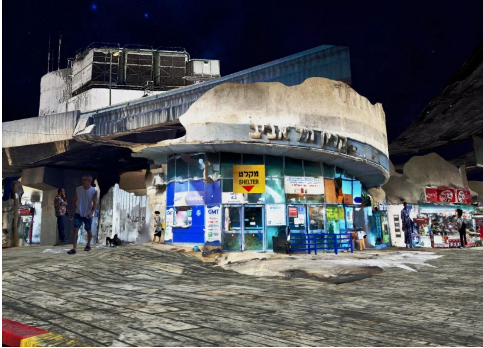
Last Station, 2025 Photography, 3D scanning, and modeling

المحطة الأخيرة، 2025 تصوير، مسح ثلاثي الأبعاد ونمذجة