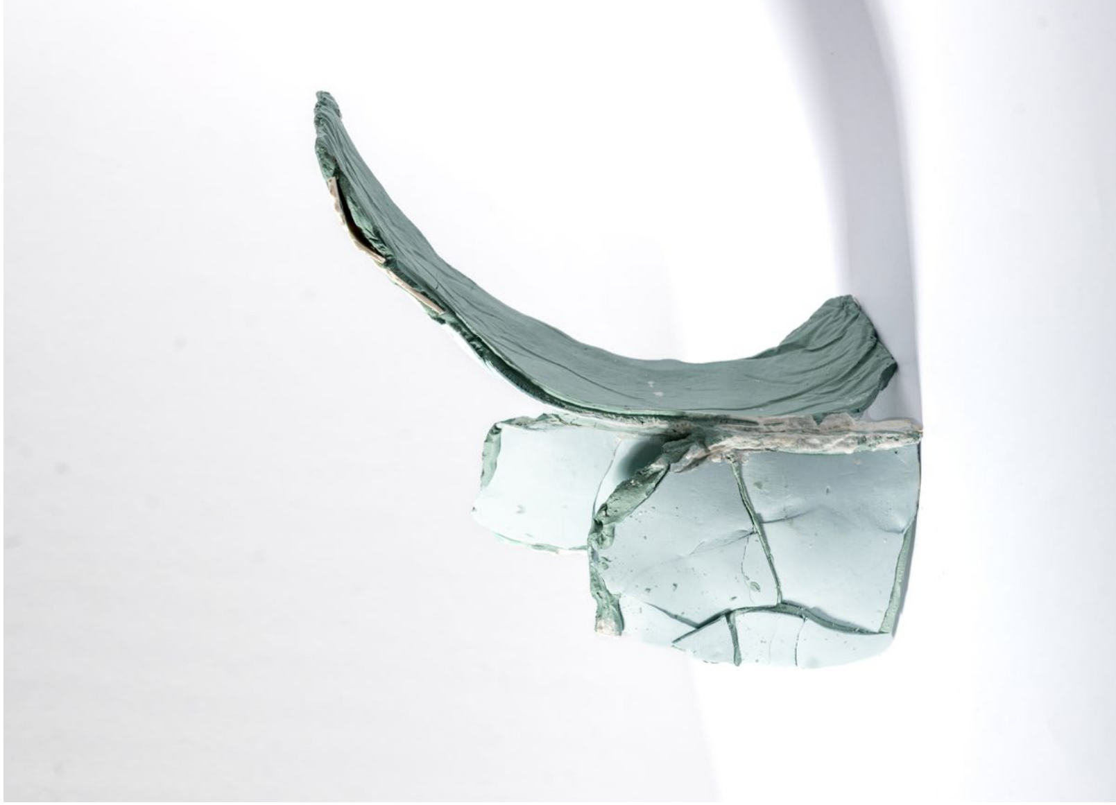
Uninvited Beauty, 2025 Hand-stained porcelain plates

جمال غير ضروري، 2025 تصوير، مسخ ثلاثي الأبعاد وتمازجته