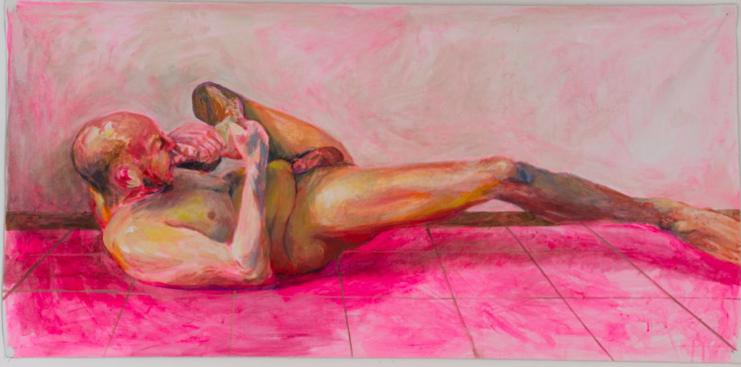
Under the Circumstances, 2024 Acrylic on canvas