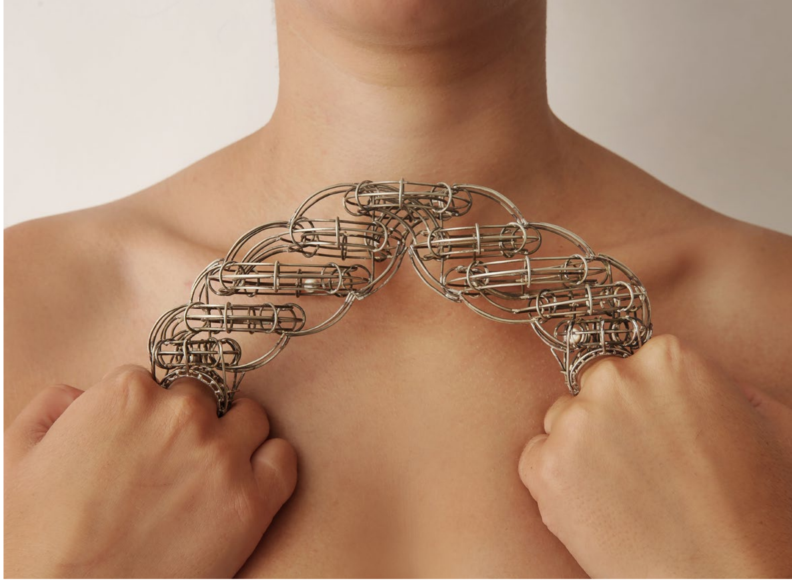
Requiem for a Water Park, 2021 Nickel silver and silver rods

مرثية لونا غال, 2021 فضة نيكيل وألواح فضة