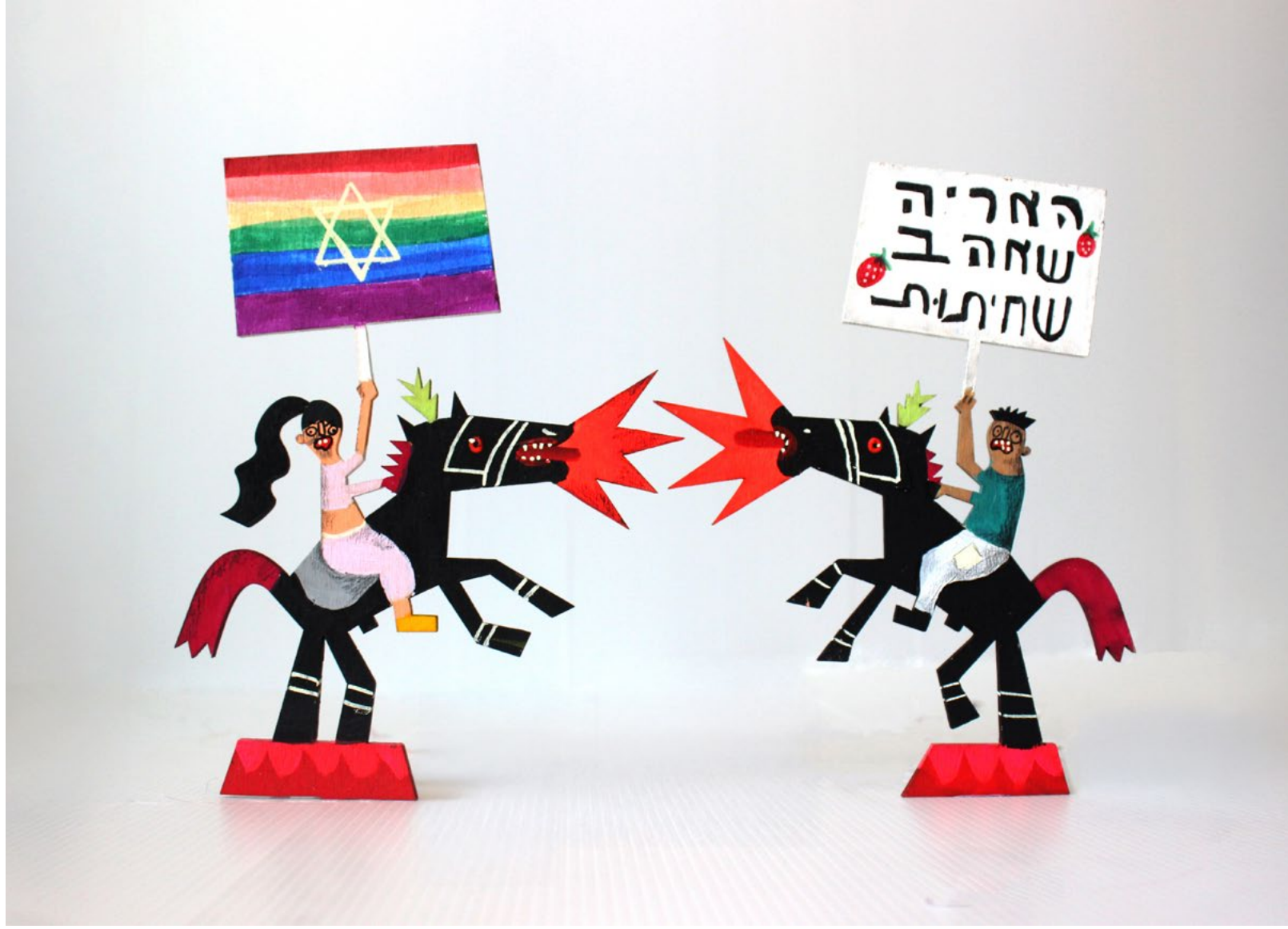
Rebellion & Amusement, 2025 Illustrated wood installation