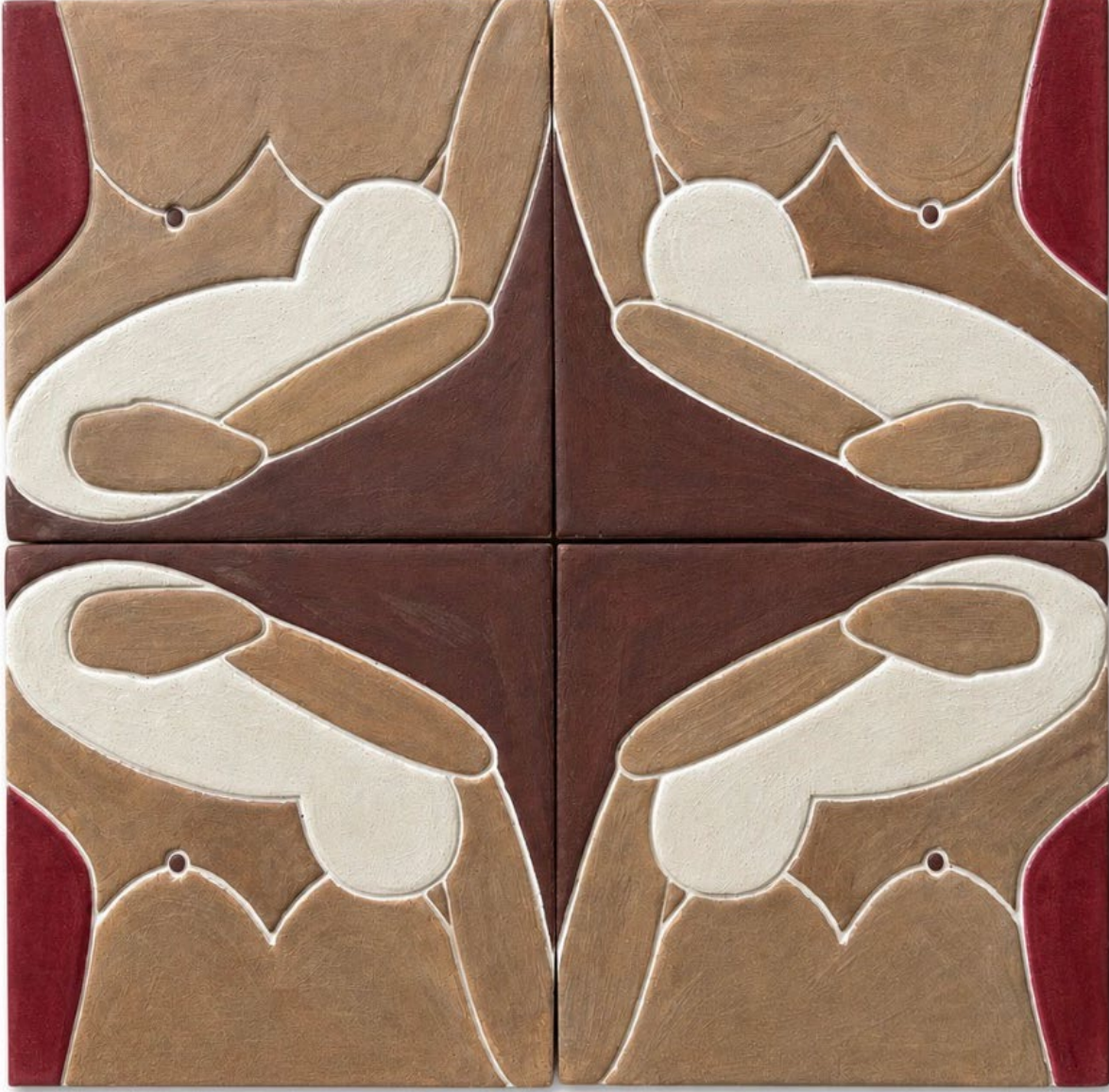
Motherhood, 2026 Impressions on clay surfaces, mixtures of clays, glaze

أمومة، 2026 "توجد الطقات على أسطح صلب، وهي عبارة عن مخاليط من أنواع مختلفة من الصلصال والطلاء الزجاجي