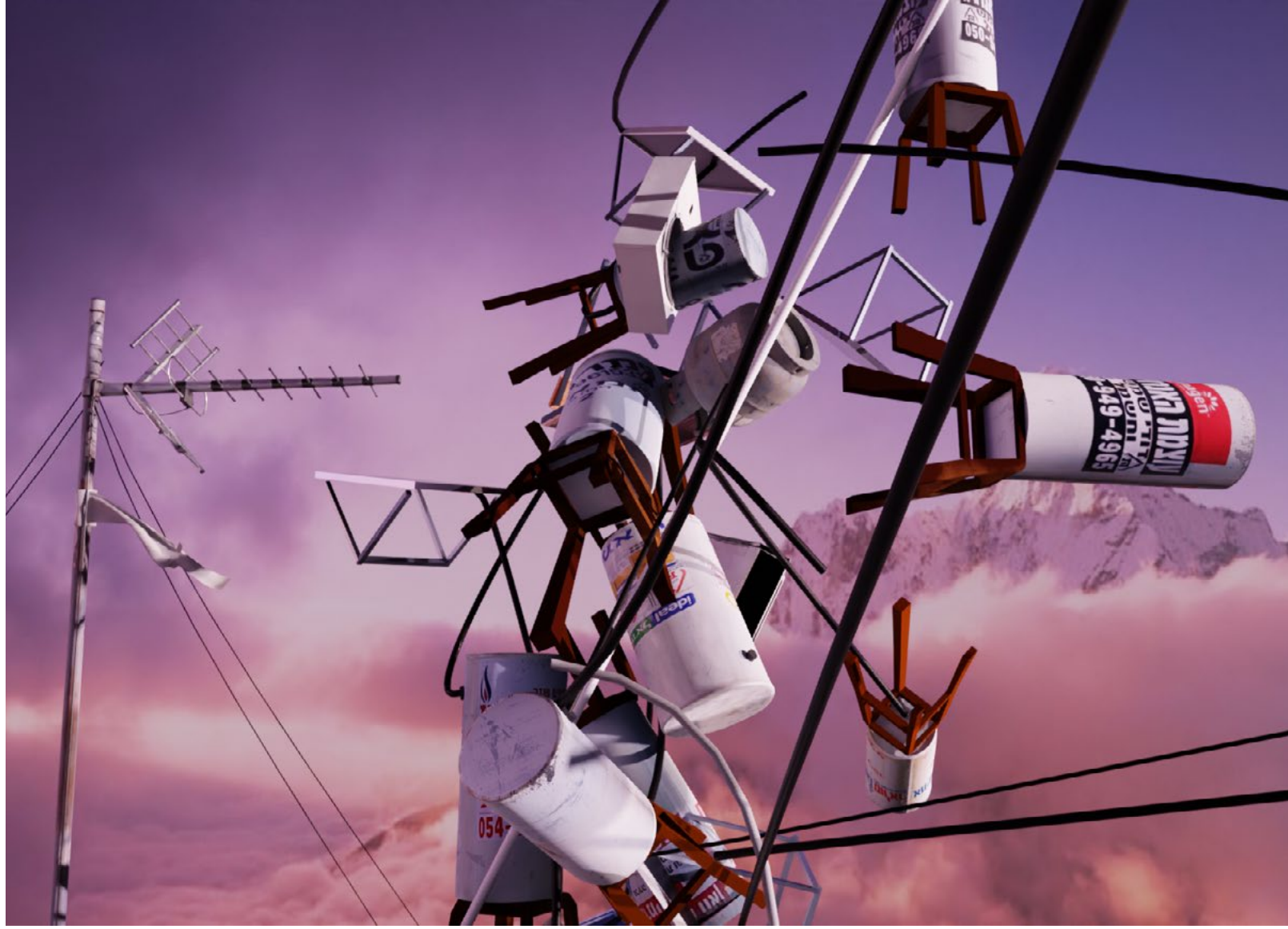
The Eighth Place, 2026 Video animation

في المركز الثامن، 2026 فيديو رسوم متحركة